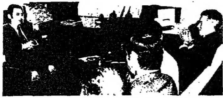
اتحاد المباحثات بين فانس وخدام بحضور أعضاء الوفدين السوري والسوري

لعبة التسويات قبل التسوية من المبالغة القول ان القتل ينتظر سيروس فانس في نهاية جولته في الشرق الأوسط. فالمقتل يرد في الأساس تبعاً للمستمر فانس. وهو الرجل الأول الذي ساعد في طلبة وزير الخارجية الأمريكية في واشنطن. بل هو السفير الذي يحرس الرئيس كارتير على حياته وهو يتجول في كل لحظة.